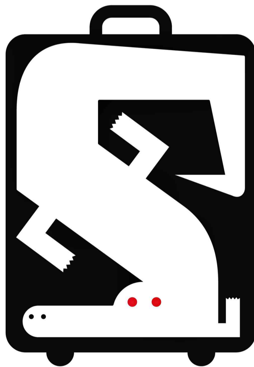
Illustrationen von Zabinski